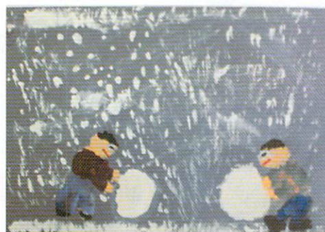
小学校一年生 雪の日

※勤労市民センターには駐車場がございませんので、お車でお越しの際には周辺の時間貸し駐車場等をご利用のうえご来館下さい。