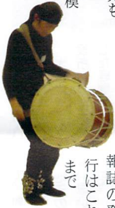
報誌の発行はこれまで

〈想い〉の活動の中心は、会報誌の作成・発送、東京電力による賠償相談会です。会報誌の発行はこれまで